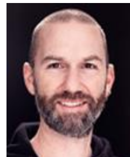
Ivan Zumbühl, Präsident ASW

Mit dem Werbeleistungsvertrag hat die ASW einen Branchenstandard geschaffen, der die vertragliche Regelung der Zusammenarbeit zwischen Werbeauftraggeber und Werbeagentur in jeder Hinsicht umfassend und fair regelt. Die nachfolgend vorgestellten ASW-Werbeagenturen kennen sich im Umgang mit dem Werbeleistungsvertrag aus und können Ihnen allfällige Fragen beantworten. Zudem finden Sie weitergehende Erläuterungen zu bestimmten Themen auf der Website des Werbeleistungsvertrages unter www.werbeleistungsvertrag.ch im Kapitel «Fragen und Antworten», wo Sie übrigens selber Fragen stellen können – selbst dann, wenn Sie (noch) nicht mit einer ASW-Agentur zusammenarbeiten!